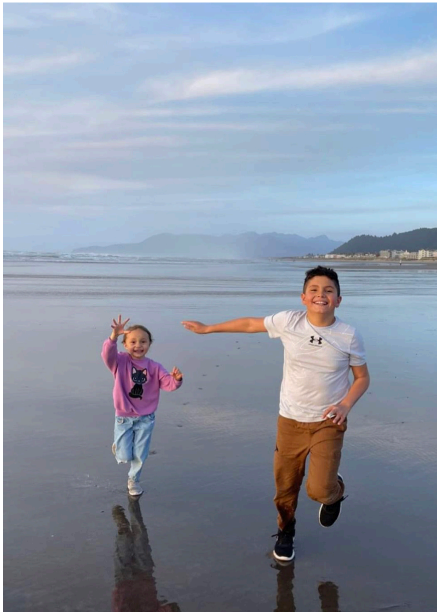
Муҳаммад Бекжоннинг неваралари Эрен ва Лия.