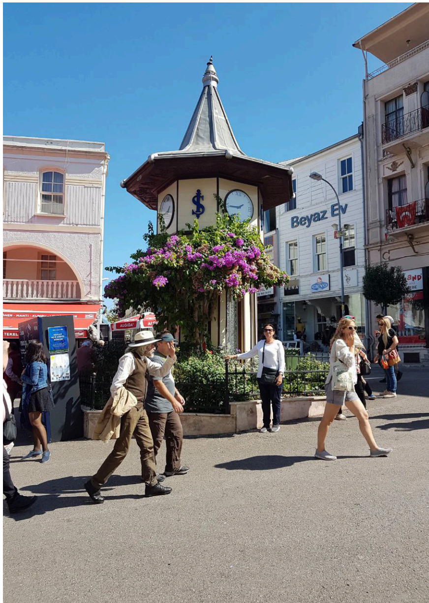
Мармара денгиздаги Адалар ороли