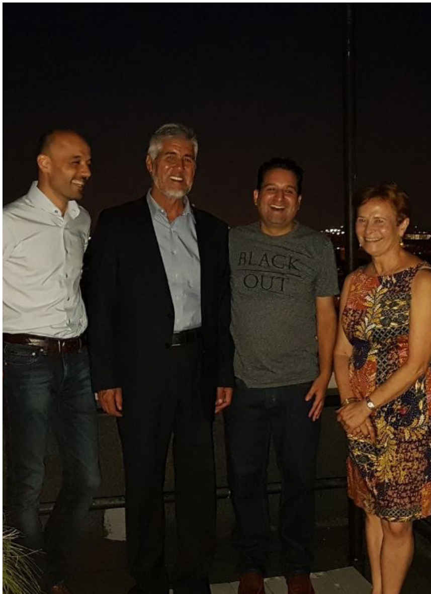
2018 йил, Сентябрь. Вашингтон шаҳрида