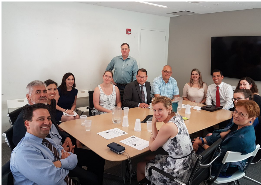
2018 йил, Сентябрь. Вашингтон шаҳридаги бир анжуманда...