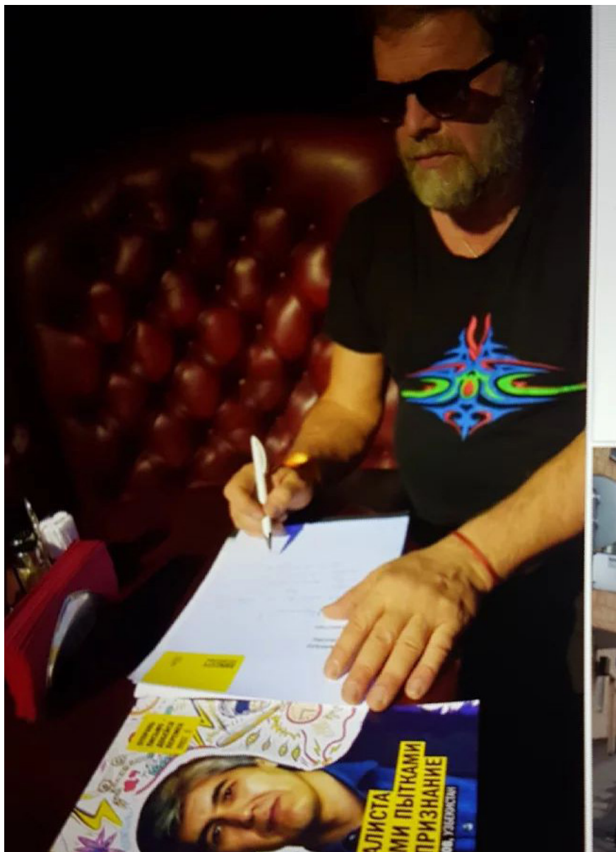
Рус эстрада қўшиқчиси Борис Гребеншиков қамоқдан озод этилгани сабаб Муҳаммад Бекжонга табрик хати йўллади